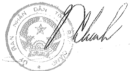
Nguyễn Văn Linh